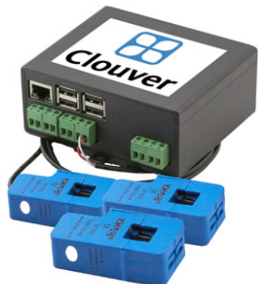
Das Smartkit Gateway

Das SmartKit verfügt über vier Eingänge zur Strommessung und drei Eingänge zur Spannungsmessung. Dadurch sind Messungen an allen drei Phasen und sogar dem Neutraleiter möglich.